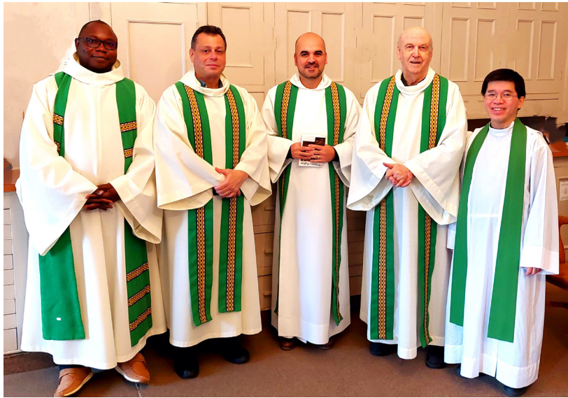
Le Secrétaire général de l'Union pontificale missionnaire (à droite) de passage au Canada.

La vocation est le mystère de l'élection divine : " Ce n'est pas vous qui m'avez choisi ; mais c'est moi qui vous ai choisis et vous ai établis pour que vous portiez du fruit et que votre fruit demeure " (Jn 15, 16). " Nul ne s'arroge à soi-même cet honneur, on y est appelé par Dieu, absolument comme Aaron " (He 5, 4). " Avant même de te former au ventre maternel, je t'ai connu ; avant même que tu sois sorti du sein, je t'ai consacré ; comme prophète des nations, je t'ai établi " (Jr 1, 5). Ces paroles inspirées ne peuvent qu'éveiller une crainte profonde en toute âme sacerdotale.